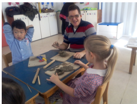
Alcuni momenti dei laboratori

In uno degli incontri ci siamo divisi in gruppi con bambini e adulti. Al centro del tavolo c'era un grosso blocco d'argilla e attrezzi vari e abbiamo costruito un castello di principessa. Eravamo tutte femmine sono stata bene con i bambini. Un giorno siamo